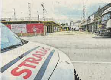
Die Strabag ist Österreichs größter Baukonzern.