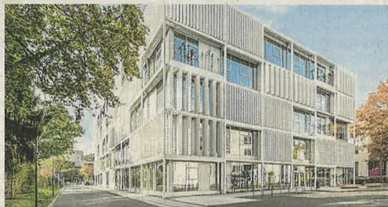
Die äußere Gebäudehülle bietet Sonnenschutz und Begrünung.