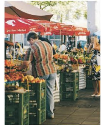
Bunte Vielfalt und tolle Einkaufsmöglichkeiten in ODOs Umgebung.