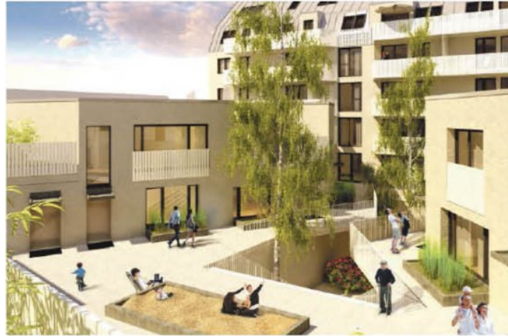
Wohnen in völliger Entspannung: Am Fuße des Wilhelminenbergs entstehen bis Dezember 2015 62 neue Wohnungen.

Die PRISMA legt bei jedem Wohnungsprojekt großen Wert auf eine qualitativ hochwertige Ausführung. In Zusammenarbeit mit dem Architekturbüro querkraft entstand „ODO lebt“ mit differenzierten Wohnungstypologien für jeden Geschmack (2-5 Zimmer/45-120 m 2 ). Die