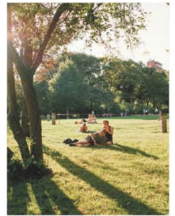
Natur genießen im Kongresspark oder am Wilhelminenberg.